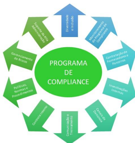
Figura 2 - Programa de Compliance