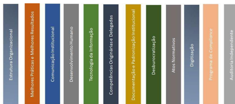
Figura 1: Eixos Estratégicos do Ambiente de Controle: