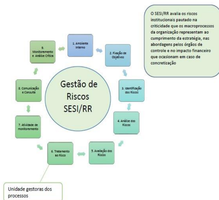
Figura 3 – Gerenciamento de Riscos

O Controle Interno executa o monitoramento e documentação das entregas previstas pelos proprietários de risco. A análise crítica é executada pelo Time de Riscos, que realiza a leitura das entregas e referenda as ações previstas no tratamento de riscos. As principais atividades de monitoramento incluem conciliações, acompanhamento de comunicações de agentes externos e internos, inventários, auto avaliações e verificação contínua, bem como a avaliação constante da matriz de GRC, com intuito de fortalecer ainda mais as entidades, em busca da melhoria contínua.